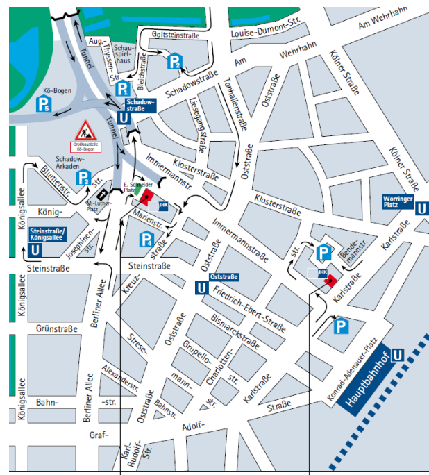
Industrie- und Handelskammer zu Düsseldorf Ernst-Schneider-Platz 1 40212 Düsseldorf